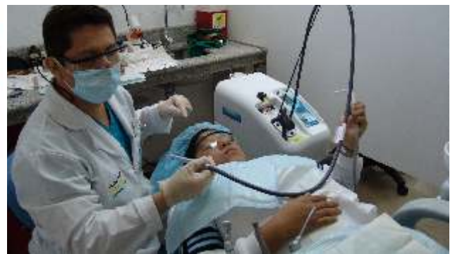
Foto real de intervención odontológica con equipo láser