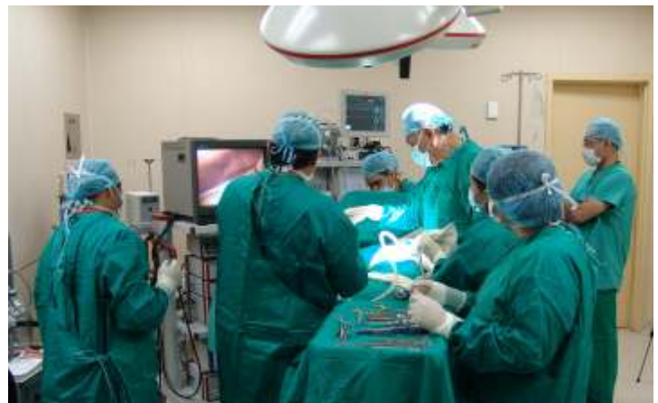
Foto real del equipo médico del Hospital Universitario en intervención quirúrgica laparoscópica